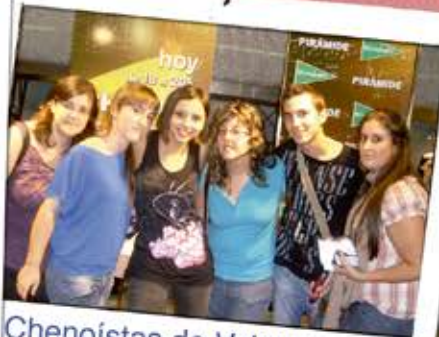
Chenoístas de Valencia, Alicante y Huelva con Chenoa