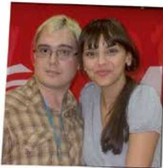
Toni y Chenoa