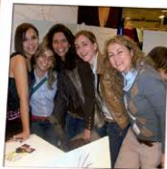
Chenofergueras y Chenoa