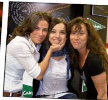
Gemelas de Bilbao y Chenoa