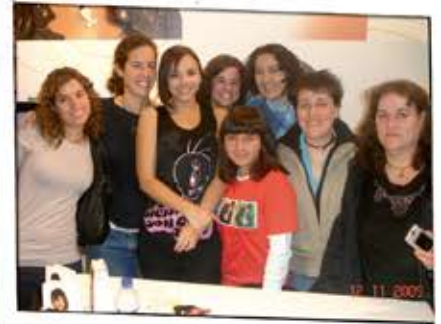
Chenoístas de Madrid con Chenoa