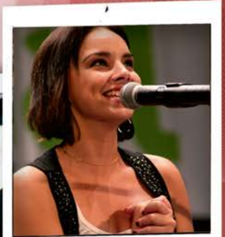
Atrévete Cadena Dial