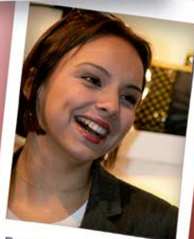
Feria Intergift 2010