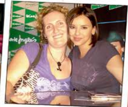
Olga y Chenoa